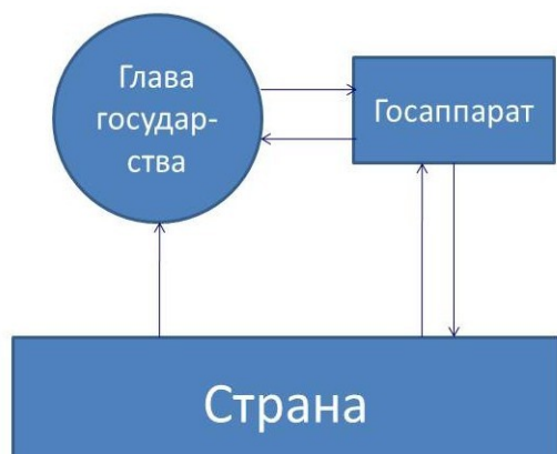
Рис. 2. Государственное управление при отсутствии профессионального блока концептуальной (жреческой) власти