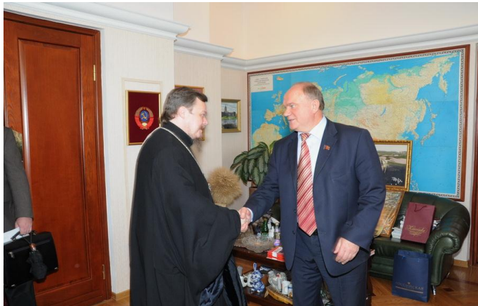
Дух Бендера витает над ними: Почём будем торговать «опиум для народа»?

На этот проект работают и многие «раскрученные» политические аналитики, возможно сами того толком не понимая: М.Л.Хазин, С.Е.Кургинян, М.В.Леонтьев, С.А.Марков, Н.В.Стариков, М.Калашников и другие. Втянулась в него и КПРФ.