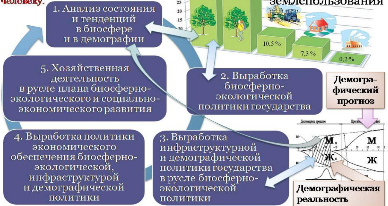
Рис. 1. Взаимная обусловленность частных управленческих задач в ходе реализации концепции устойчивого развития.

Деньги – «слуга», а не «господин» человеку.