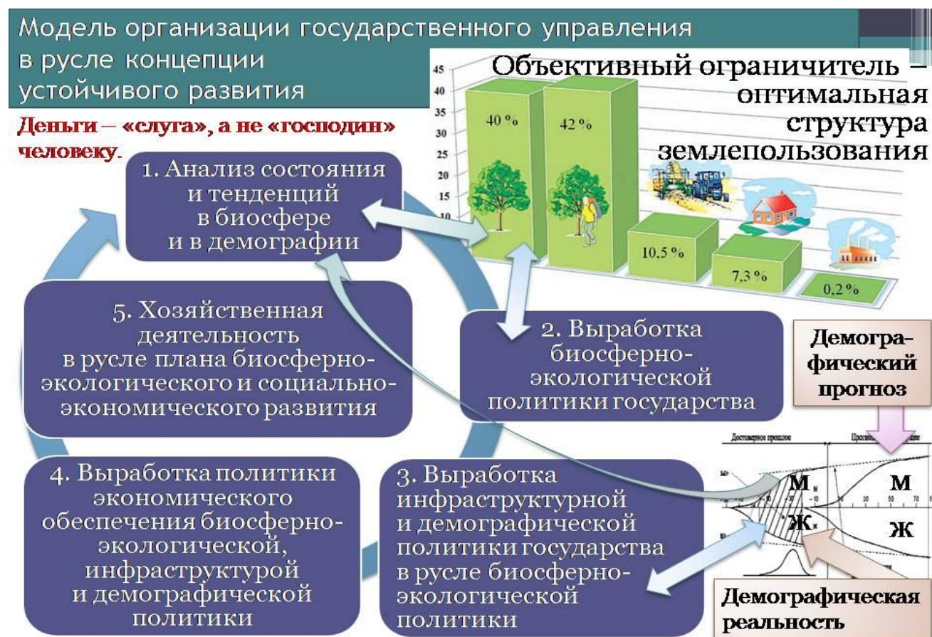
Рис. 1. Взаимная обусловленность частных управленческих задач в ходе реализации концепции устойчивого развития.

Если же исходить из того, что Конституция СССР 1936 г. — Конституция общества, свободного от страхов, люди в котором живут под властью диктатуры совести, а не бюрократии, то следование ей в практической политике в принципе позволяет реализовать государственное управление в соответствии с объективно необходимой цикличкой постановки и решения задач общественного устойчивого развития в гармонии с Природой и обеспечить военно-экономическую безопасность общества и государства: см. рис. 1 и пояснения к нему в Приложении.