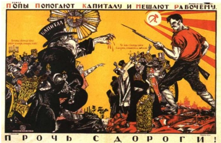
Плакат периода становления Советской власти

Статья 11. Споры между сильными разрешаются по понятиям. Понятия имеют силу традиции. Понятия выше законов. В случае если понятия и законы противоречат друг другу, законы применяются в той части, в которой они не противоречат понятиям.