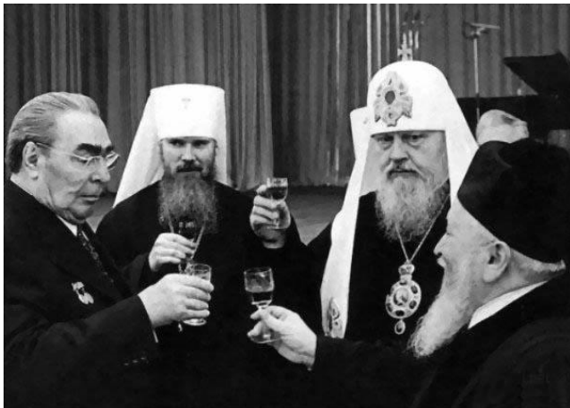
Иерархи идеологической власти библейского проекта в СССР в полном составе на приѣме в Кремле в честь 60-летия Великой октябрьской социалистической революции.

Но если соотноситься со схемой управления толпо-«элитарным» обществом «концептуальная власть — идеологическая власть — государственность — общество», то в 1917 г. смены концептуальной власти не было. Концептуальная власть осталась прежней — властью хозяев библейского проекта глобализации, однако при этом идеология