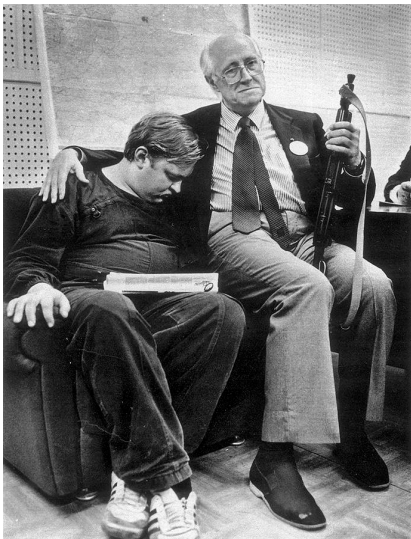
Виолончелист М.Л. Ростропович в здании Верховного Совета РСФСР в дни ГКЧП в 1991 г.

Куль личности получит новое определение — "сталинский социализм". Роль Иосифа Сталина в новом учебнике вообще оценена неоднозначно. Первые годы его правления названы «периодом форсированной индустриализации, модернизации, осуществленной чрезвычайными методами». Результатом той модернизации названо преодоление технологического отставания от западных стран.