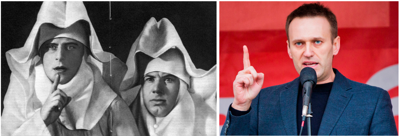
Слева — кадр из советского фильма «Праздник святого Йоргена» (1930 г.). В кадре главный мошенник, которого играет Анатолий Кторов, и его помощник, которого играет Игорь Ильинский. Справа — Алексей Навальный на одном из митингов.

Есть ещё Алексей Анатольевич Навальный и «навальнята». Там тоже нет проекта будущего, одно только неприятие настоящего. Но такая характеристика недостаточна. Писать об этом много нет желания, но картинки ниже показывают суть.