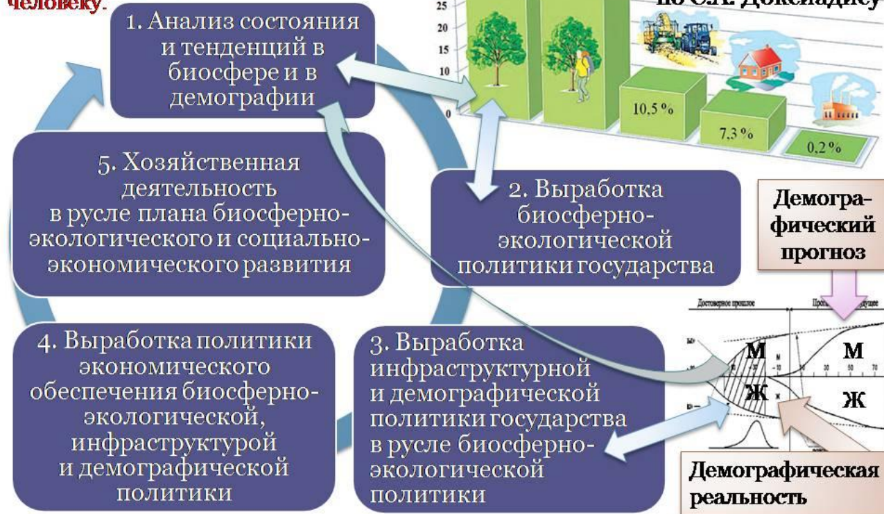
Рис. 1. Взаимная обусловленность частных управленческих задач в ходе реализации концепции устойчивого развития.

Деньги – «слуга», а не «господин» человеку.